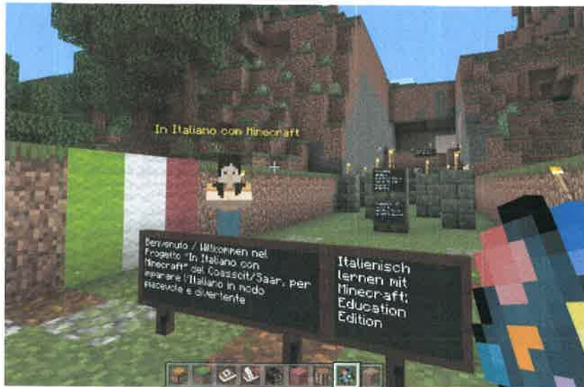
Ein Projekt von Coasscit/Saar e.V.