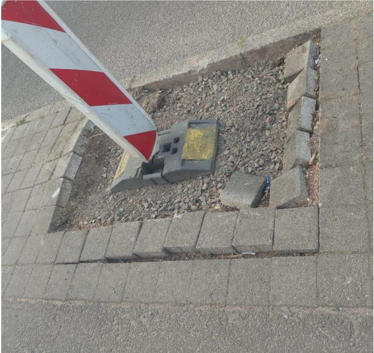
Ort: Am Hochrech kurz hinter der Kreuzung zum Westring